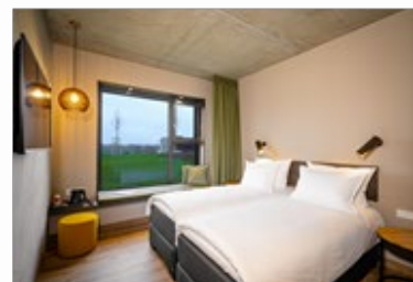
Doppelzimmer im das flax allgäu