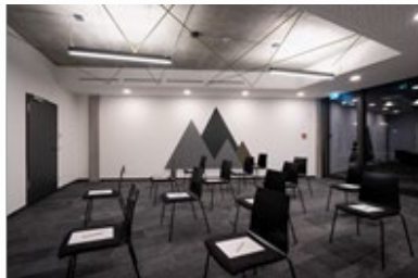
Tagung 2